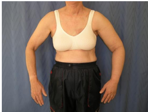
Lymfödem i vänster armen efter bröstcancerbehandling