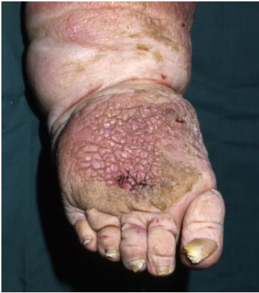
Figur 2 Exempel på papillomatos, hyperkeratos och fördjupade hudveck