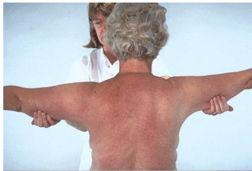
Figur 5 Palpation av konsistensökning i vävnaden

Vävnadskonsistens: Genom palpation av hudveck bilateralt på kroppen kan man jämföra tjockleken på friska och ödematösa sidan (Figur 5).