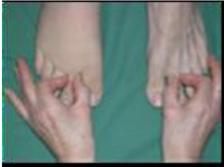
Figur 4 Stemmers test