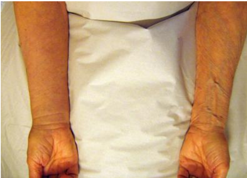
Figur 1 Mindre synliga vener på höger underarm